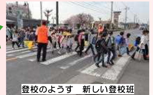
登校のようす 新しい登校班