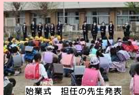
始業式 担任の先生発表