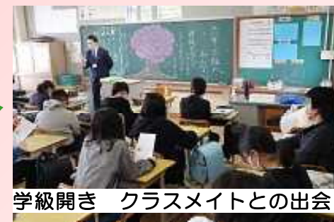
学級開き クラスメイトとの出会い